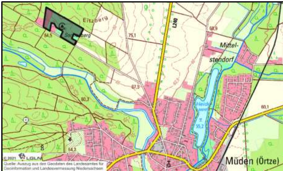
Übersichtsplan: Lage des Plangebietes (ohne Maßstab)